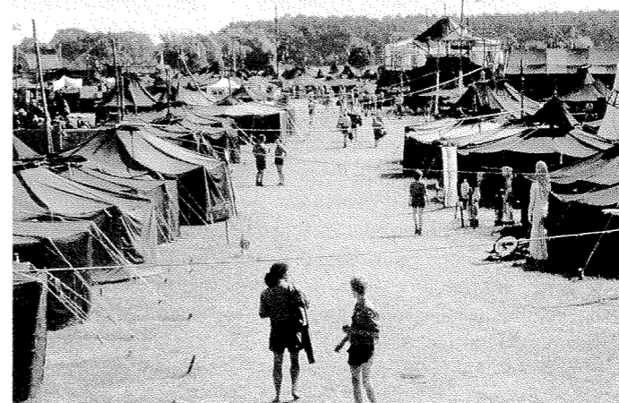
Straße der Begegnung.