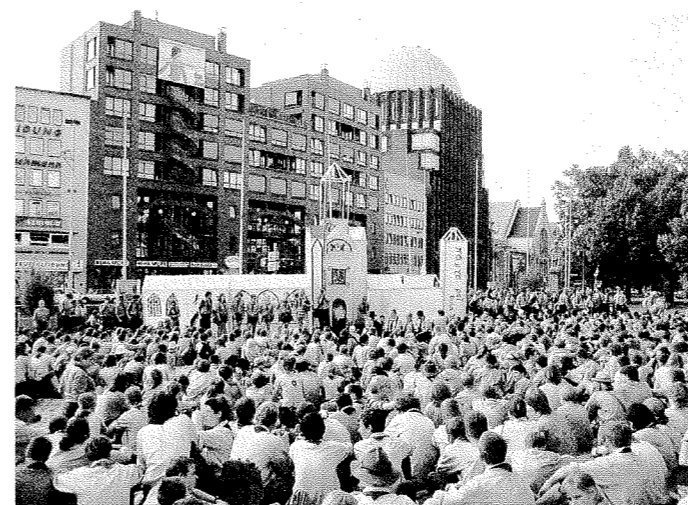
Viele Kirchen – eine Kathedrale.

Brand im Stadtarchiv verloren gegangenen Informationen neu zusammenzutragen und dadurch Geld für einen Kirchenbau zu erwirtschaften. Dazu mussten die in acht „Kirchengemeinden“ eingeteilten Gruppen knifflige Aufgaben lösen, sich in Wettkämpfen messen und die Baumaterialien besorgen.