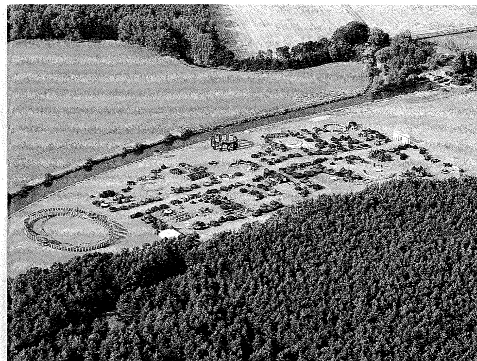
Eine Zeltstadt wie im antiken Delphi.